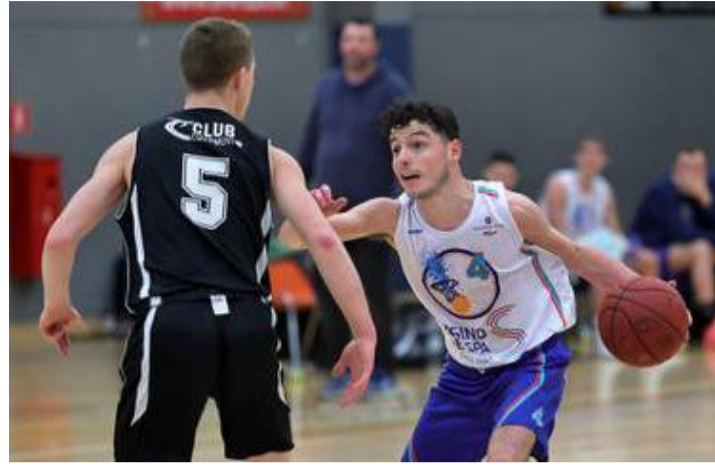
Spa pouvait reprendre seul la tête du classement. C'est raté.

Tour reposait ainsi sur Spa qui, dimanche, pouvait reprendre seul la tête du classement en cas de victoire dans la salle de Saint-Louis. Mais, là aussi, nos couleurs n'ont pas réussi à imposer leurs vues.